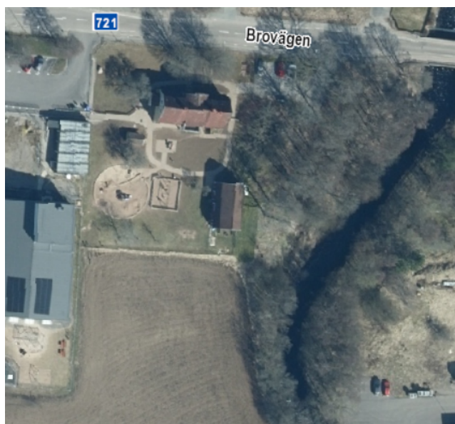
Bild 5. Ortofoto över planområdet.

Planområdet är beläget centralt i Kinnareds samhälle. Väster om planområdet finns idag en förskola samt skola som fortsatt planeras att verka på platsen. Därav är det viktigt att kommande förändringar i planområdet inte påverkar skolans verksamhet negativt, både gällande skolans fysiska plats men även platser så som trottoaren mellan Brovägen och planområdet som barn använder för att ta sig till och från skolan. Utfart ifrån planområdet bör därför ej flyttas eller bli fler. Eftersom Brovägen är en statlig väg regleras detta i väglagen. För att inte störa skolans verksamhet är det satt en högsta nockhöjd på sju meter för eventuella nya byggnader, nya byggnader får inte placeras närmre än 4,5 meter ifrån fastighetsgränsen, det är satt en begränsning av högsta byggnadsarea. En annan planbestämmelse reglerar dessutom att verksamhet inte får vara störande för omgivningen. I närheten av planområdet ligger förutom skolan olika verksamheter såsom affärer och fabriker. Det är önskvärt att kommande användning på platsen bidrar till samhällets utveckling.