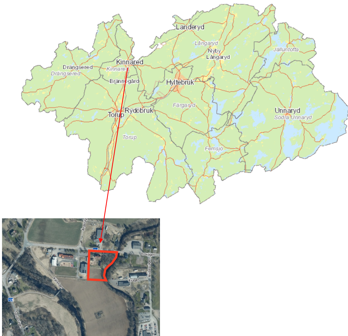
Bild 2. Översiktlig bild av aktuellt planområde.

Läge, areal och avgränsning: Planområdet ligger söder om Brovägen och dess trottoar som löper igenom centrala Kinnared. Till väster om planområdet finns Kinnareds skola och förskola, till öster återfinns Österån. Norr om planområdet är det planlagt för småindustri-, bostads- och handelsändamål, söder om planområdet är marken inte planlagd men består av åkermark. Planområdet berör enbart delar av fastigheten Kinnareds Prästgård 1:1. Planområdets omfattning är ca 7800 m 2 .